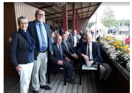
Landsskuet er også her netværket bliver plejet

Følg sikkerhedskampagnen fra SAGRO - "THINK SAFETY FIRST!"